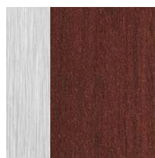
RESOPAL² der nahtlose Materialmix

Resopal GmbH Hans-Böckler-Straße 4 D-64823 Groß-Umstadt Tel. 0 60 78 - 80 208 Fax 0 60 78 - 80 624