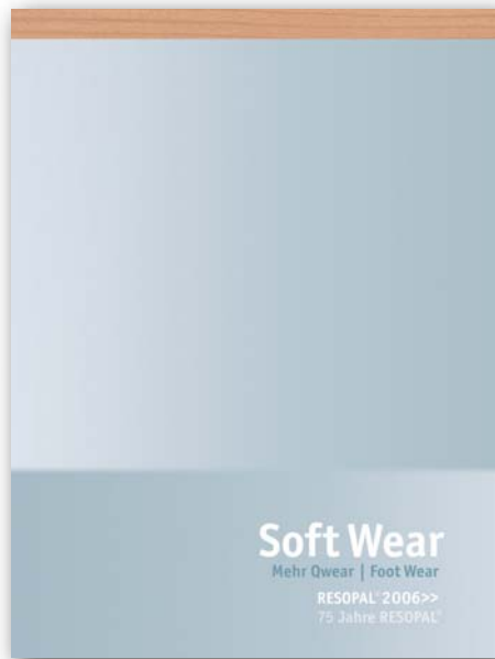
Trendbuch RESOPAL® 2006>> Soft Wear