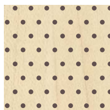
RESOPAL®-A2coustic über 70% Schallabsorption