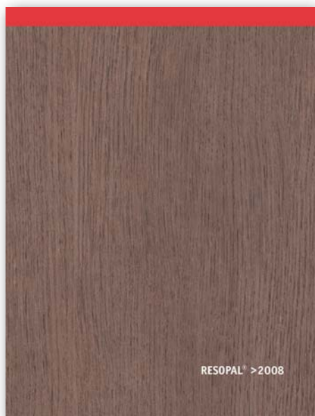
Standardkatalog RESOPAL® >2008

Fordern Sie bitte unseren Standardkatalog RESOPAL® >2008 und das diesjährige Trendbuch RESOPAL® 2006>> Soft Wear an. Dort finden Sie außer unseren Kollektionen, die Ihnen alle für RESOPAL® Direct zur Verfügung stehen, weitere für Ihren Einsatzbereich interessante Produkte wie etwa unsere Akustikplatte RESOPAL®-A2coustic.