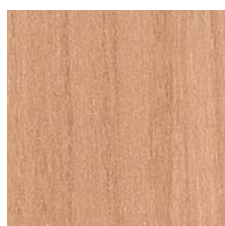
Oberfläche EM die Steigerung von Holz