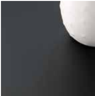
60 - Matte

Matt, robust, unempfindlich gegen Schmutz.