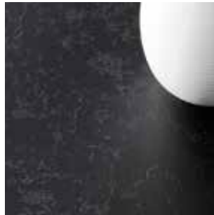
RM - Real Material

Matte, unregelmäßige Steinstruktur, Betonporen, universell einsetzbar.